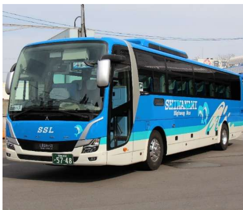
【しまなみバスが運行する高速乗合バス】

（※）タッチ決済対応のカード（クレジット、デビット、プリペイド）や、カードが設定されたスマートフォン等